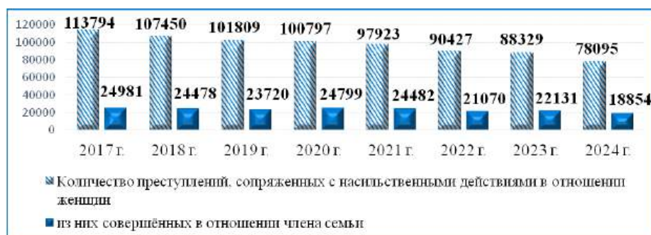
Рис. 2. Динамика количества преступлений, сопряженных с насильственными действиями в отношении женщин в Российской Федерации за 2017 — 2025 годы

Закономерно с вышеприведенными данными на протяжении исследуемого периода снижалась и динамика количества всех преступлений, сопряженных с насильственными действиями в отношении женщин (на 31,4 % — с 113 794 преступлений в 2017 г. до 78 095 в 2024 г.) и женщин-членов семьи (на 24,5 % — с 24 981 преступления в 2017 г. до 18 854 в 2024 г.). На рис. 2 мы можем видеть долю домашнего насилия в отношении женщин по сравнению с общим количеством насильственных преступлений в отношении женщин [там же].