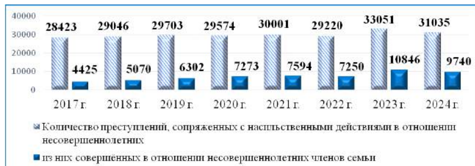
Рис. 3. Динамика количества преступлений, сопряженных с насильственными действиями в отношении несовершеннолетних в Российской Федерации за 2017 — 2024 годы

крайне тревожная, поскольку закладывает конфликтный фон семейных отношений на долгие годы.