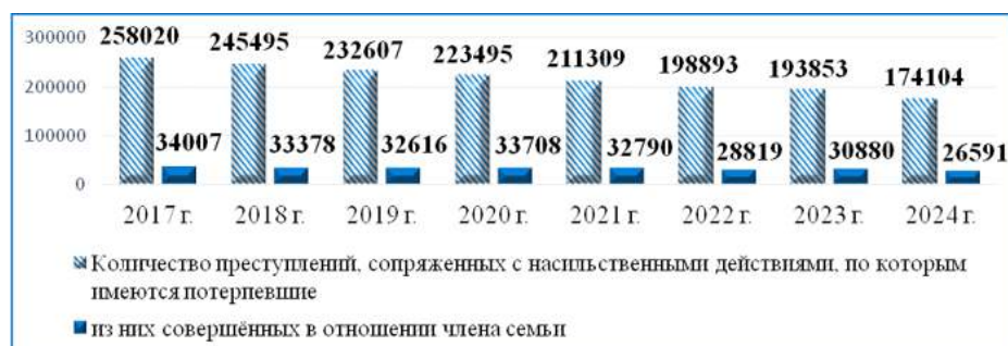
Рис. 1. Динамика количества преступлений, сопряженных с насильственными действиями, по которым имеются потерпевшие, в Российской Федерации за 2017 — 2024 годы

Закономерно с вышеприведенными данными на протяжении исследуемого периода снижалась и динамика количества всех преступлений, сопряженных с насильственными действиями в отношении женщин (на 31,4 % — с 113 794 преступлений в 2017 г. до 78 095 в 2024 г.) и женщин-членов семьи (на 24,5 % — с 24 981 преступления в 2017 г. до 18 854 в 2024 г.). На рис. 2 мы можем видеть долю домашнего насилия в отношении женщин по сравнению с общим количеством насильственных преступлений в отношении женщин [там же].