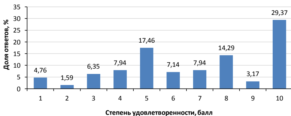
Рис. 3. Удовлетворенность работающих матерей временем, проводимым с детьми

Нам было важно понять, насколько работающие матери удовлетворены возможностью уделять ребенку/детям достаточное количество времени. Респонденткам было предложено оценить степень своей удовлетворенности по шкале, где 1 балл означает «полностью не удовлетворен», 10 — «полностью удовлетворен». Данные об удовлетворенности матерей временем, проводимым с детьми, представлены на рисунке 3.