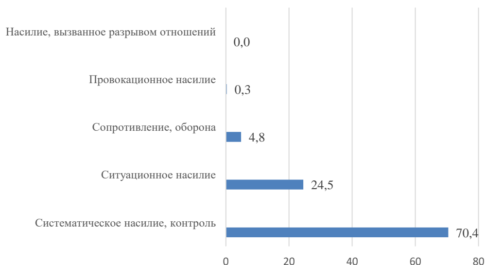
Рис. 2. Представленность типов насилия в сообщениях, %

Приведем результаты анализа представленности в текстах типов насилия (рис. 2). Сообщения о систематическом насилии (постоянно повторяющемся во времени) и контроле занимают 70,4 % случаев. Например: «Родственники погибшей заверяют, что сельчанин долгие годы жестоко избивал супругу...»; «...сожитель 12 лет унижает меня разными способами»; «Каждый божий день муж издевается надо мной».