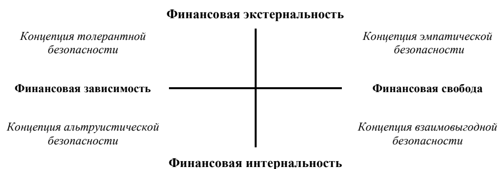
Рис. 2. Модель взаимосвязи концепций личной безопасности женщин в браке и факторов их финансового поведения в семье

Визуализации выявленных связей способствует модель на рисунке 2, построенная по наиболее очевидным закономерностям.