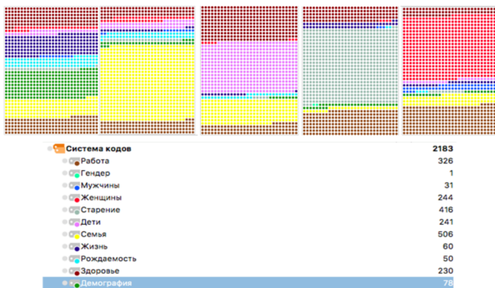
Рис. 4. Портрет документов: 1) Концепции демографической политики (2007 г.), 2) Концепции семейной политики (2014 г.), 3) Национальной стратегии действий в интересах детей (2012 г.), 4) Национальной стратегии действий в интересах граждан старшего поколения (2016 г.) и 5) Национальной стратегии действий в интересах женщин (2017 г.) (номера 1) — 5) соответствуют порядку расположения документов)

Используя еще один инструмент количественного анализа — портрет документов, основанный на частоте упоминания слов и словосочетаний, сгруппированных в смысловые коды, опишем изменения в «букве и духе» документов социально-демографической политики 2007—2017 гг. (рис. 4).