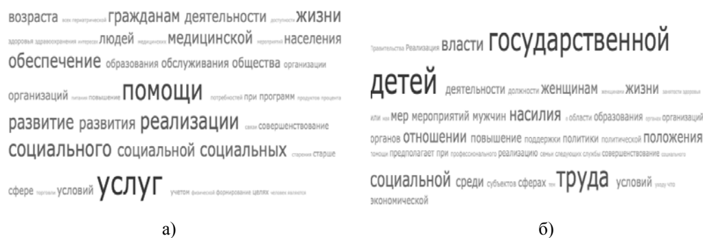
Рис. 3. Облако тегов а) Национальной стратегии действий в интересах граждан старшего поколения (2016 г.), б) Национальной стратегии действий в интересах женщин (2017 г.)

На рисунке 3 облака тегов Национальной стратегии действий в интересах граждан старшего поколения и Национальной стратегии в интересах женщин выявляют один из основных подходов, характерных для данных документов, — акцент на патернализм (зависимость от государственной поддержки). Слова «помощь» и «услуга» преобладают в первом тексте и слово «государственной» (власти, политики) во втором. В Нацстратегии в интересах женщин акцент сделан на материнстве (слово «детей») и труде («труд»), что очень напоминает советскую модель социальной политики в области так называемого женского вопроса: защита материнства и детства, создание условий для совмещения родительских и производственных обязанностей исключительно для женщин (у читателя новой семейной концепции возникает эффект дежа-вю). Вновь поддерживается только «контракт работающей матери» [Темкина, Роткирх, 2002].