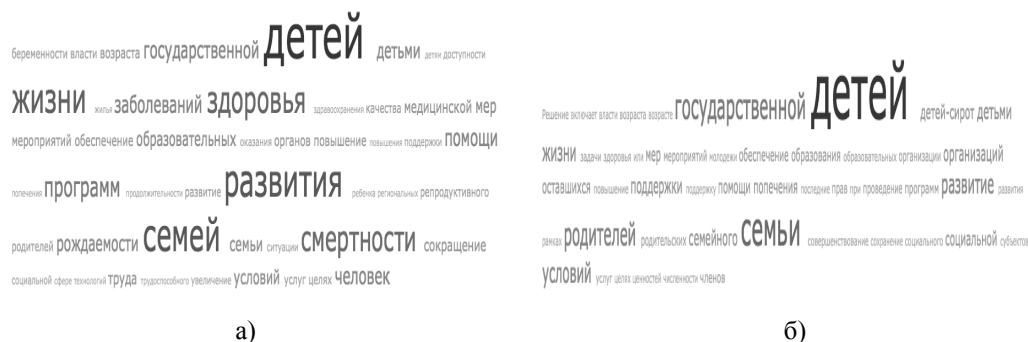
Рис. 2. Облако тегов а) Концепции демографической политики (2007 г.), б) Концепции семейной политики (2014 г.)

На рисунке 2 мы видим, что Концепция демографической политики даже богаче акцентами в области развития человеческого потенциала, чем Концепция семейной политики. Концепция семейной политики в целом проигрывает в разномобразии акцентов и Концепции демографической политики.