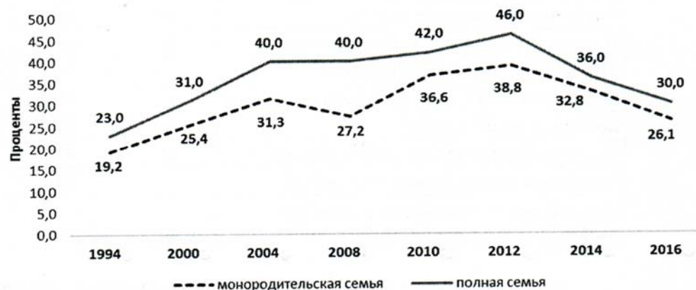
Рис. 2. Доля родителей из монородительских и полных семей, уверенных, что в ближайшие 12 месяцев их семья будет жить «намного лучше» и «немного лучше», % (по данным RLMS-HSE за 1994—2016 гг.)

считают, что будут жить хуже, чем сейчас, 51,5 % — считают, что ничего не изменится, и лишь 22,3 % — настроены позитивно. Показатели негативных оценок жизненных перспектив в 2015—2016 гг. стали самыми высокими за последние полтора десятилетия.