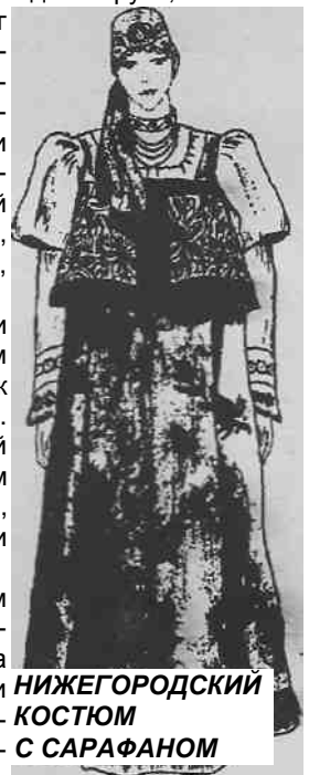
НИЖЕГОРОДСКИЙ КОСТЮМ С САРАФАНОМ