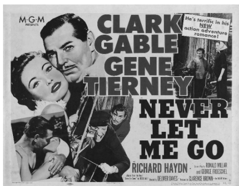
Ил. 3. Плакат фильма «Не отпускай меня» (1953)

ненных Штатов [24, р. 246—248]. С началом Холодной войны кинематограф возвращается к прежнему сюжету в таких картинах, как «Не отпускай меня» («Never Let Me Go», 1953, реж. Д. Дэйвс) (ил. 3), «Шелковые чулки», «Железная юбка» и «Пилот реактивного самолета». Наконец, британский фильм «Из России с любовью» («From Russia with Love», 1963, реж. Т. Янг) стал, пожалуй, наиболее известным примером в этом ряду: ради любви Джеймса Бонда советский агент Татьяна Романова пренебрегает служебным долгом и бежит на Запад.