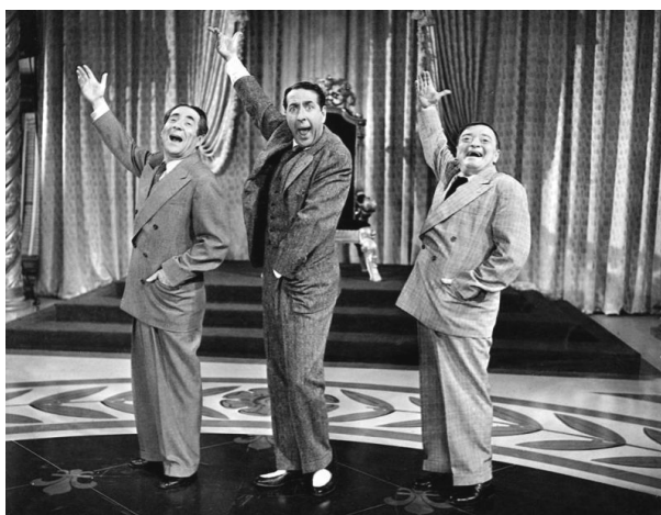
Ил. 4. Советские чиновники в фильме «Шелковые чулки» (1957)

Очевидно, такой выбор героинь определялся не только преимуществами капиталистической системы над социалистической, но и превосходством западной маскулинности над советской. Это неудивительно: кровожадные комиссары, беспринципные и вороватые чиновники, безжалостные шпионы, туповатые военные, забытые обыватели — вот основные типы советских мужчин (ил. 4).