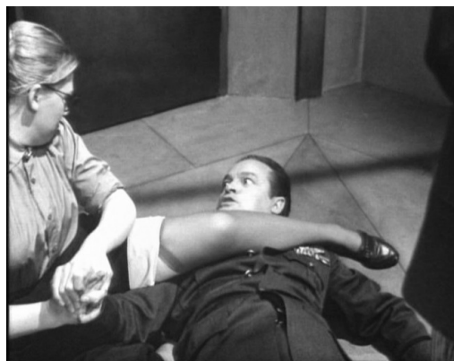
Ил. 1—2. Сцены из фильма «Железная юбка» (1956)

Спортивные успехи советских женщин расцениваются как свидетельство утраты ими женственности; так, в фильме «13 напуганных девочек» («13 Frightened Girls», 1963, реж. У. Кастл) окарικатуриваются спортивные амбиции Наташи, юной дочери советского дипломата.