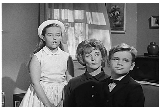
Ил. 7. Сцена из фильма «Красный кошмар» (1962)