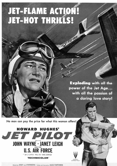
Ил. 8. Плакат фильма «Пилот реактивного самолета» (1957)

Действительно, «античеловечность» коммунизма находит отражение и в отношении к любви. Странности любви за «железным занавесом» изображаются при помощи различных приемов. Широко используются антиутопии, в которых показывается, как тоталитарное государство контролирует процесс выбора полового партнера — скажем, в экранизации романа Дж. Оруэлла «1984» (1956, реж. М. Андерсон). Утверждается, что в СССР ухаживание не может не выглядеть нелепостью и буржуазным предрассудком; Голливуд эксплуатирует старые представления в духе теории «стакана воды». Так, в фильме «Шелковые чулки» сообщается, что «если в России кто-то кого-то хочет, он просто говорит: “Ты! Иди сюда!”». Главная героиня фильма, Нина, с гордостью информирует ироничного американца: советская наука установила, что любовь — это романтические иллюзии; в основе любви лежат простейшие химические или электромагнитные процессы.