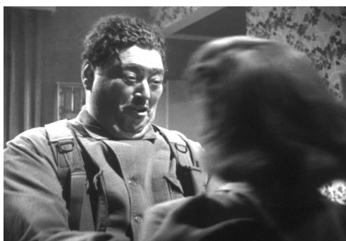
Ил. 6. Сцена из фильма «Вторжение в США» (1952)

Как известно, мобилизация нации, в первую очередь мужчин, при помощи создания картин страданий женщин, их унижения, бесчестья или сексуального насилия над ними представляет собой один из распространенных приемов военной пропаганды и дискурсивных стратегий конструирования Врага (см.: [2]). Фигура мужчины-наильника использовалась в комиксах и беллетристике (ил. 5) [7, p. 153, 159]. «Изнасилование» — популярная метафора для репрезентаций внешней политики коммунистического Другого в отношении, например, Польши и Чехословакии [26, p. 193; 22; 10]. Голливуд отдал дань этой теме в фильме «Вторжение в США» («Invasion, USA», 1952, реж. А. Грин), в котором показана полномасштабная агрессия коммунистического врага. Главная героиня предпочитает смерть перспективе быть изнасилованной пьяным солдатом (ил. 6).